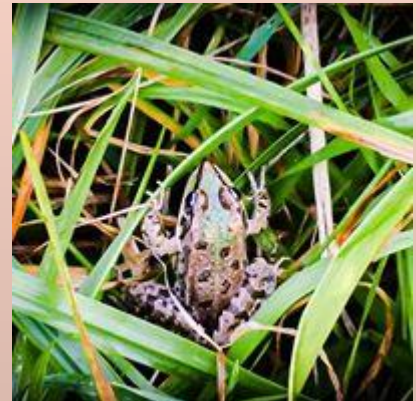
Dissimulée et discrète ...

Vous pouvez retrouver tous les « Mots mensuels » déjà parus en cliquant