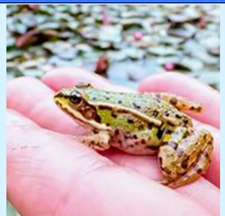
S'abandonner avec confiance ?