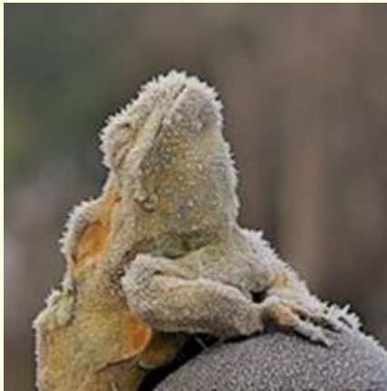
Préparée pour les froidures ...

dennes depuis plus de treize ans. Mais en 2004, il décide de dévoiler son homosexualité à ses coéquipiers ... Pour lire la suite, cliquer