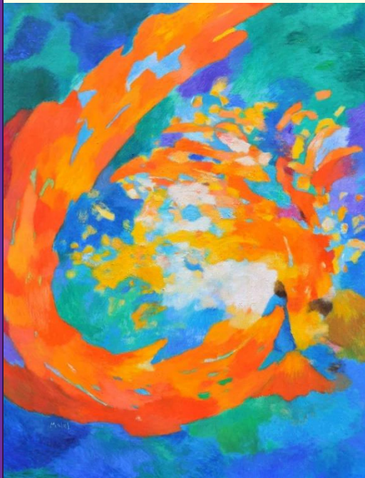
Femme et Esprit ...Malel Tapisseries

Pour consulter les infos ou activités de partenaires, cliquer