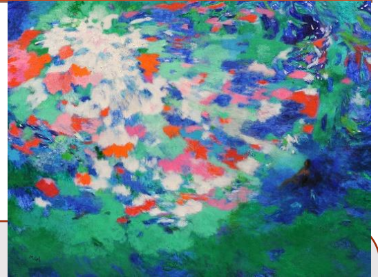
Contemplation ... Malel Tapisseries