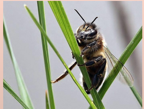
Ecouter, partager ...et se sentir utile !