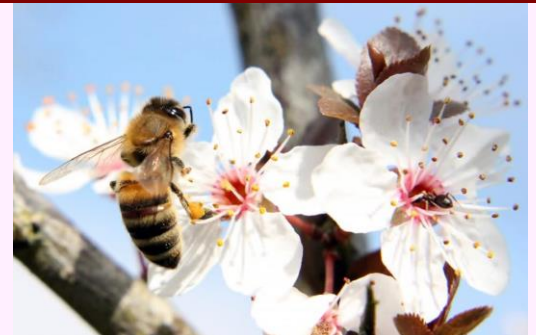
Je continue à me nourrir en admirant, en appréciant ...

chaine canicule ? Pour lire tout l'article, cliquer