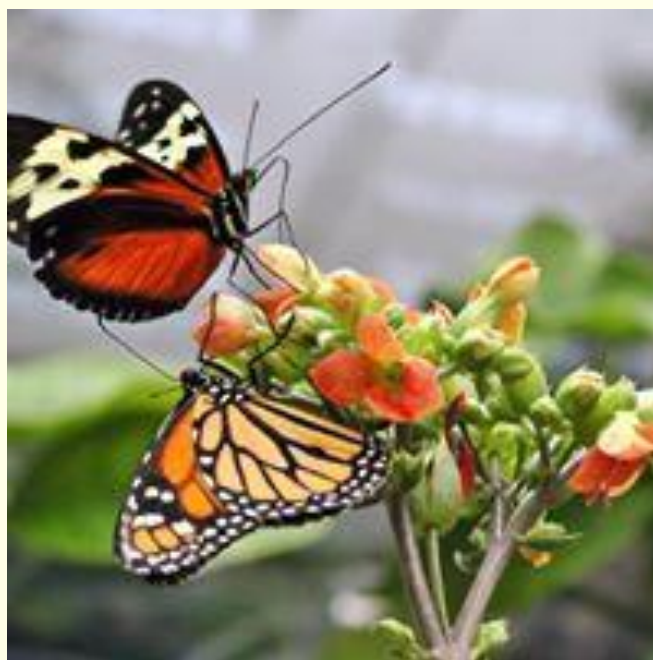
Il y a quoi là-dessous !