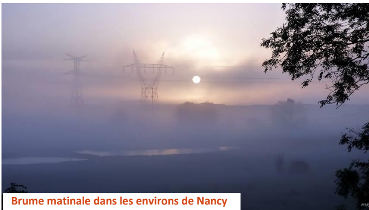
Brume matinale dans les environs de Nancy

Si vous souhaitez des rencontres spontanées 'thé, café, crêpes, cinéma, balade à pied ...' inscription sur une liste ouverte Tchat-T, cliquer.