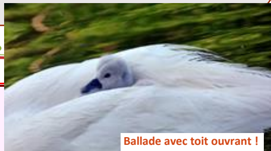
Ballade avec toit ouvrant !