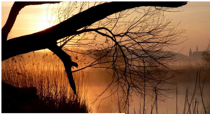
Douceur au petit matin, sur la Meurthe

Merci à l'avance pour votre participation spontanée, cliquer